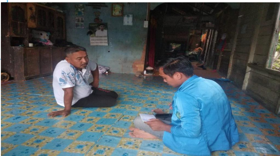
Wawancara bersama para nelayan di Desa Rantau Rasau