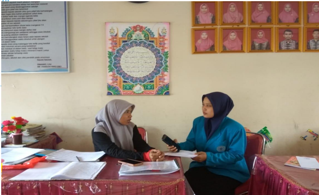
Foto Bersama Guru Olahraga SD Negeri 22/IX Tangkit