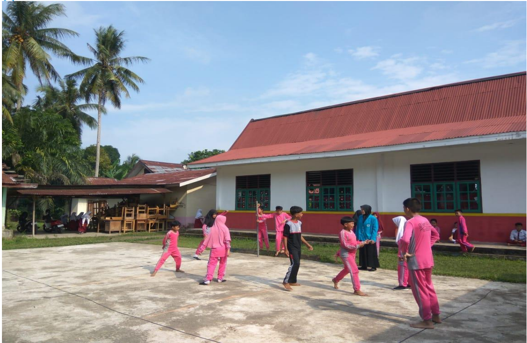
Kegiatan Bermain Permainan Gobak Sodor