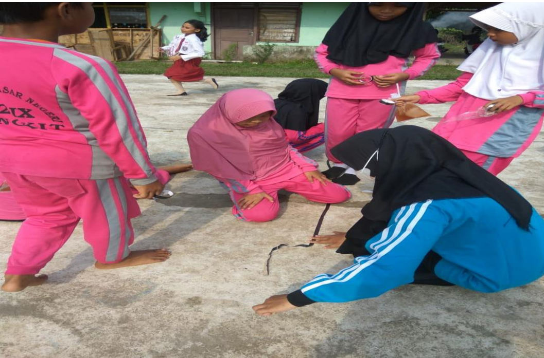
Persiapan Membuat Lapangan Untuk Bermain Permainan Gobak Sodor