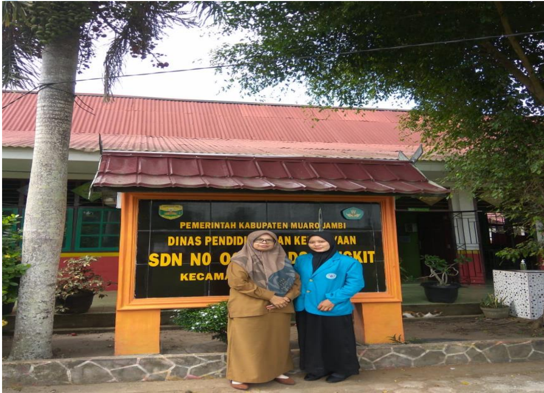
Foto Bersama Kepala Sekolah SD Negeri 22/IX Tangkit