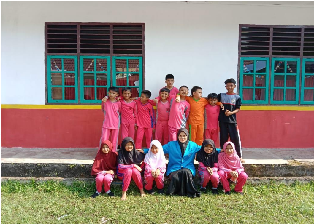
Foto Bersama Siswa Kelas V SD Negeri 22/IX Tangkit