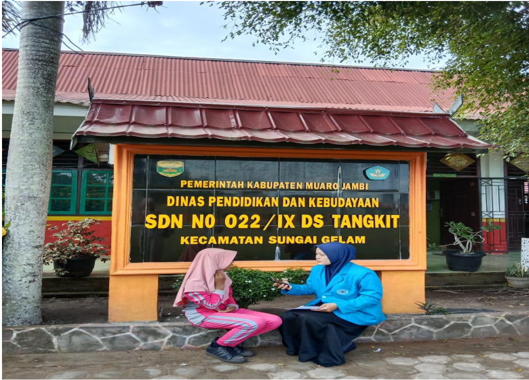
Foto Bersama Siswa Kelas V SD Negeri 22/IX Tangkit