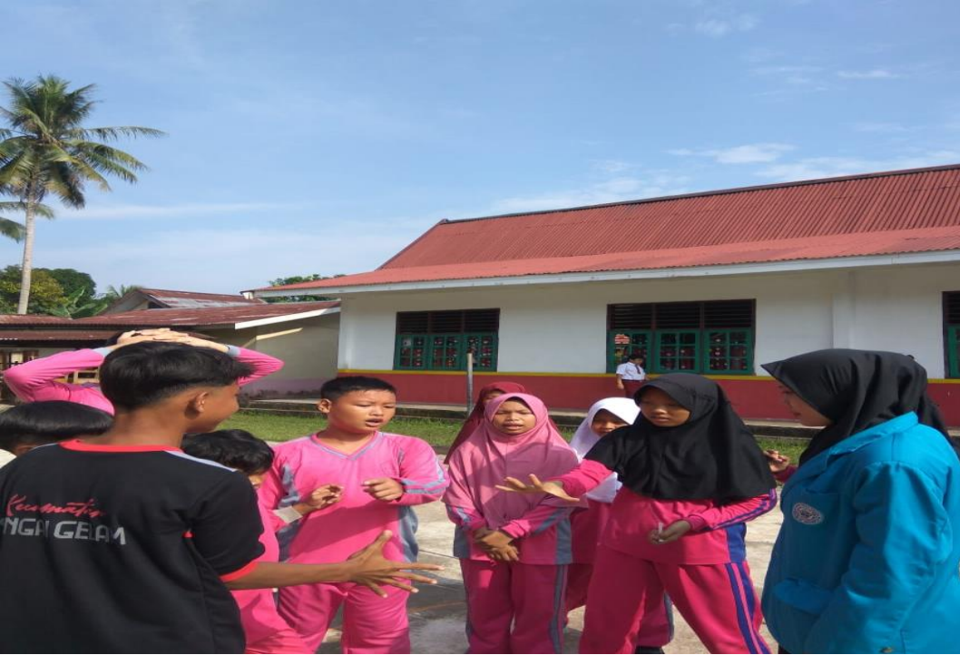
Suit Untuk Menentukan Tim Penyerang Dan Tim Jaga