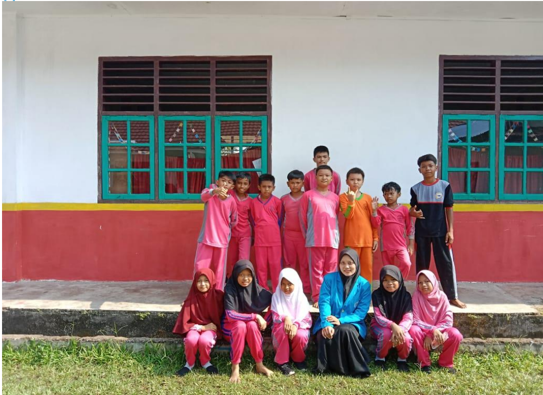
Foto Bersama Siswa Kelas V SD Negeri 22/IX Tangkit