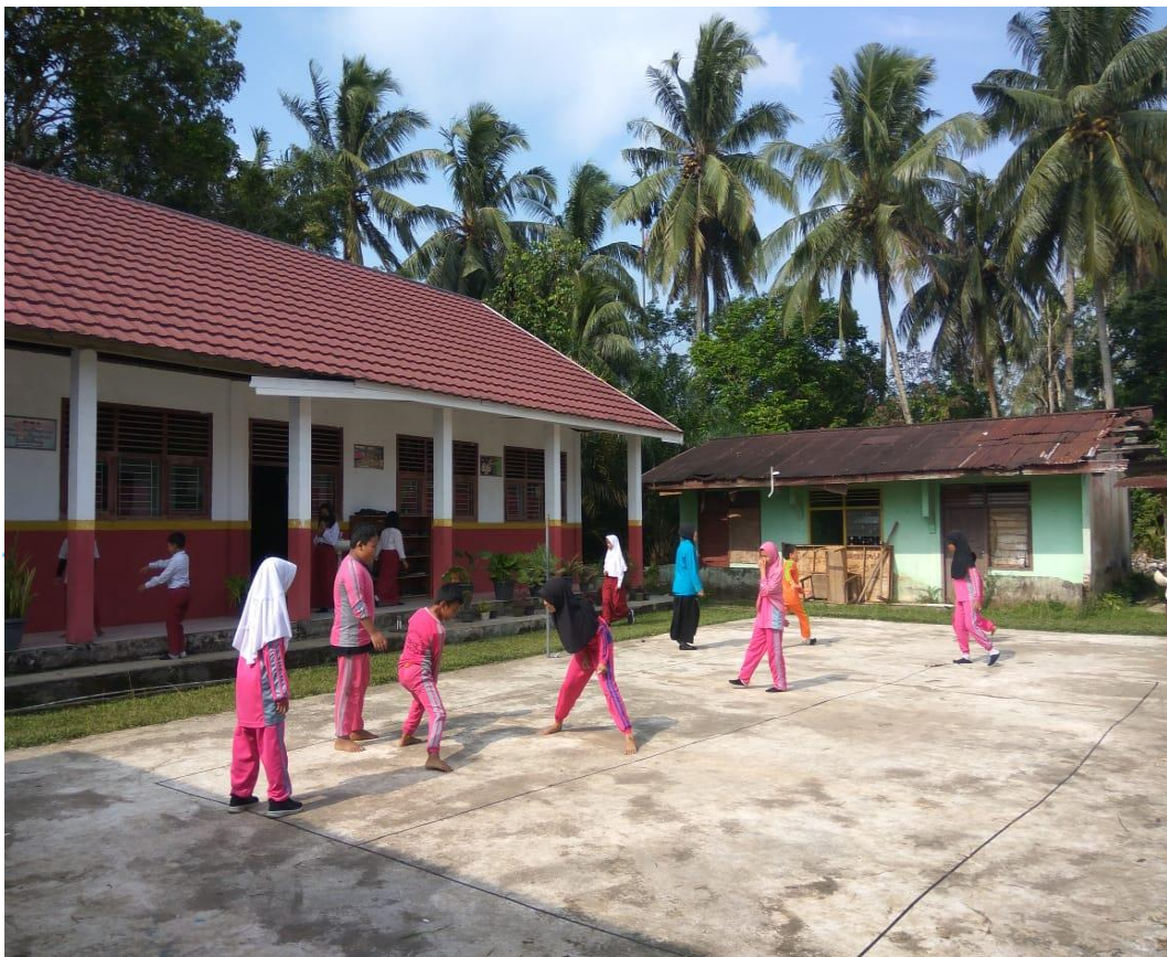
Kegiatan Bermain Permainan Gobak Sodor