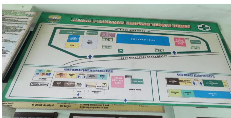
Gambar 1.2 Gedung rawat jalan dan Gedung rawat inap yang terdapat dalam denah Puskesmas Simpang Sugai Duren 57

Puskesmas Simpang Sungai Duren merupakan salah satu puskesmas yang ada di ranah Kab. Muaro Jambi yang menerapkan pelayanan program BPJS Puskesmas Simpang Sungai Duren memiliki kewajiban untuk memberikan pelayanan terhadap masyarakat pengguna BPJS sesuai dengan Peraturan Menteri Kesehatan Nomor 71 Tahun 2013 mengenai Pelayanan Kesehatan Peserta BPJS. Disisi lain Puskesmas Simpang Sungai Duren juga dilengkapi dengan 2 (dua) gedung sekaligus yakni gedung rawat jalan dan gedung rawat inap untuk melayani pasien BPJS. 56