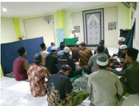
Pembelajaran setelah salat isya' kitab Bidayatul hidayah