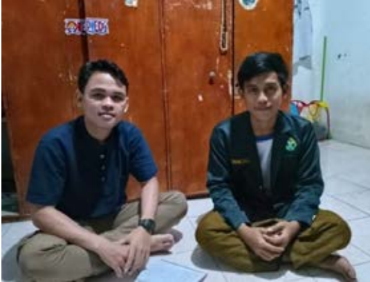
Wawancara bersama Mudabbir Ma'had Al-jami'ah