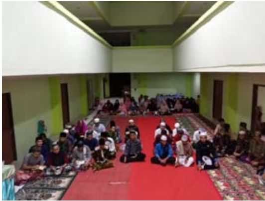
Monitoring and Evaluation bersama Pembina