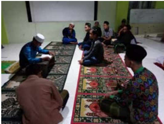
Pembelajaran setelah salat isya' kitab Nashoihul 'ibad