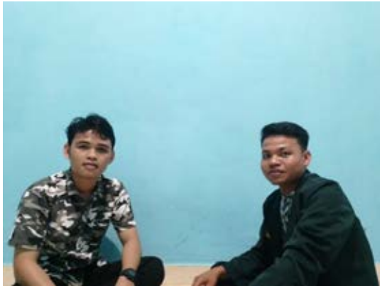
Wawancara bersama Mudabbir Ma'had Al-jami'ah