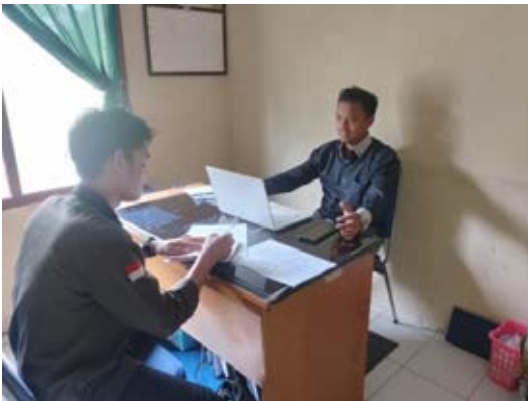
Wawancara bersama Pembina Ma'had Al-Jami'ah