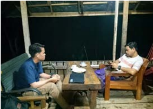
Wawancara bersama Pembina Ma'had Al-Jami'ah