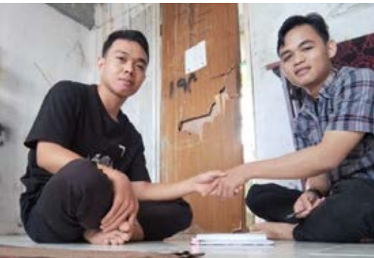
Wawancara bersama Mudabbir Ma'had Al-Jami'ah