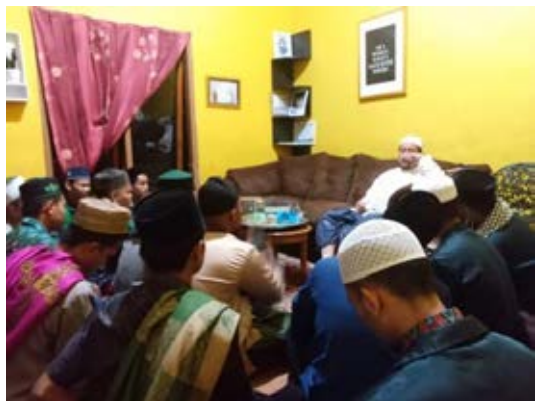
Pembelajaran setelah salat subuh ( tahsin Juz 30, Wirid dan Doa )