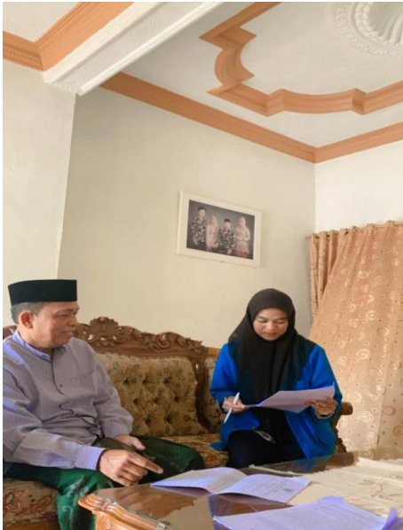
Gambar 3. Wawancara dengan Ketua Forum Kewaspadaan Dini Masyarakat