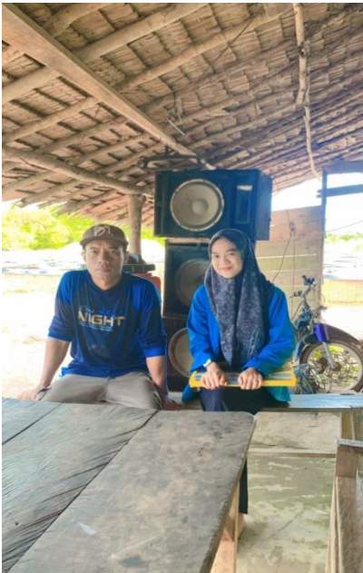
Gambar 6. Wawancara dengan Masyarakat Rt. 07 Kelurahan Simpang Rimbo Kecamatan Alam Barajo Kota Jambi