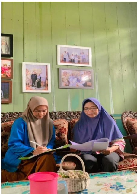
Gambar 4. Wawancara dengan Wakil Ketua Forum Kewaspadaan Dini Masyarakat