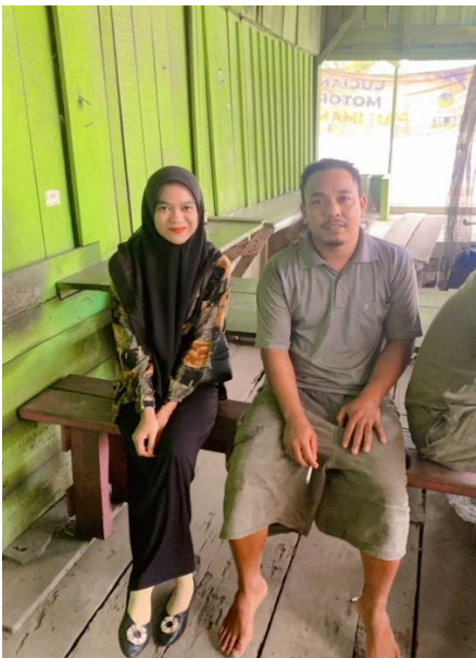
Gambar 7. Wawancara dengan Rt. 07 Kelurahan Simpang Rimbo Kecamatan Alam Barajo Kota Jambi