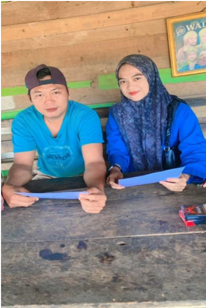
Gambar 5. Wawancara dengan Masyarakat Rt 07 Kelurahan Simpang Rimbo Kecamatan Alam Barajo Kota Jambi