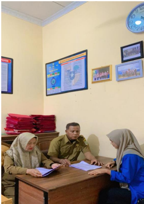
Gambar 2. Wawancara dengan Kasubbag Bidang Politik dan Kewaspadaan Daerah