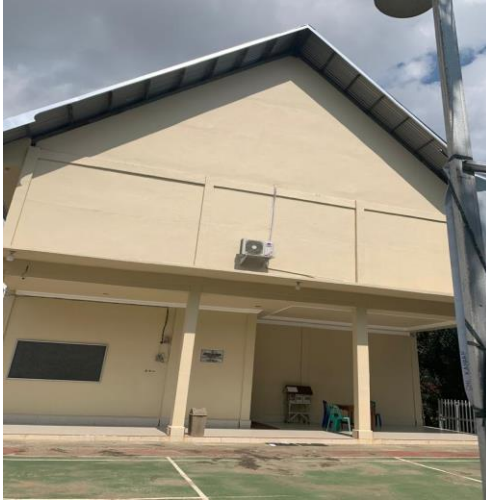
Gambar 1. Gereja Methodist