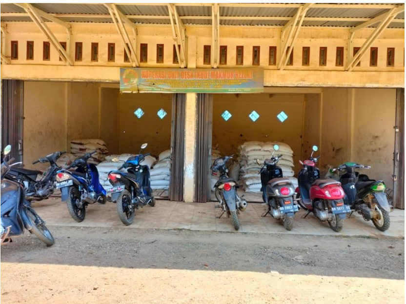
Obat- obat pertanian dan pupuk yang tersedia di KUD Makmur Rezeki