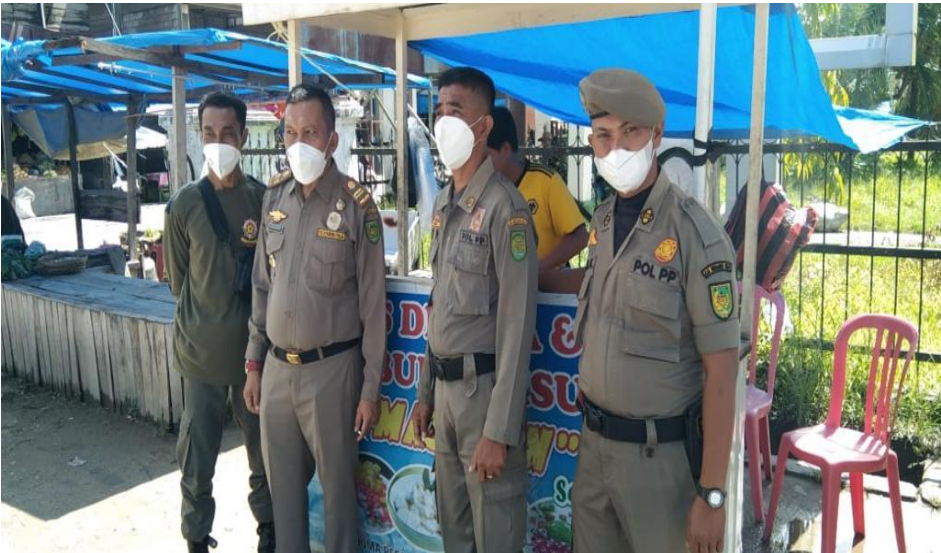
Foto Satpol PP untuk menghimbau para warga yang sedang berdagang di badan jalan