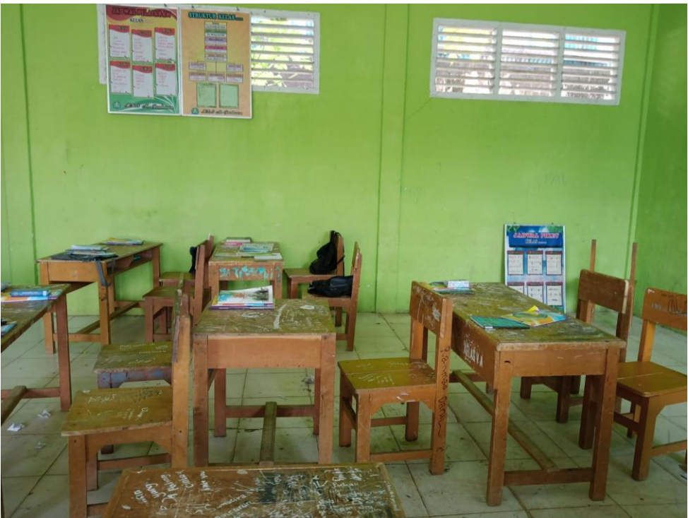
Kondisi Kelas Mts Al - Jauharen