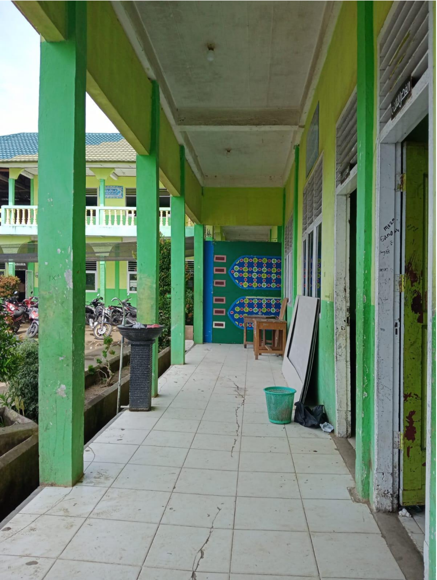
Kondisi depan Kelas