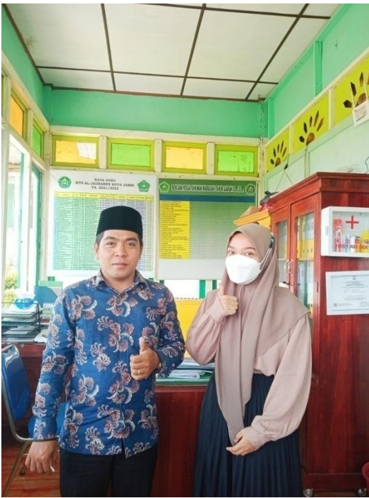
wawancara Tata Usaha MTs Al-Jauharen