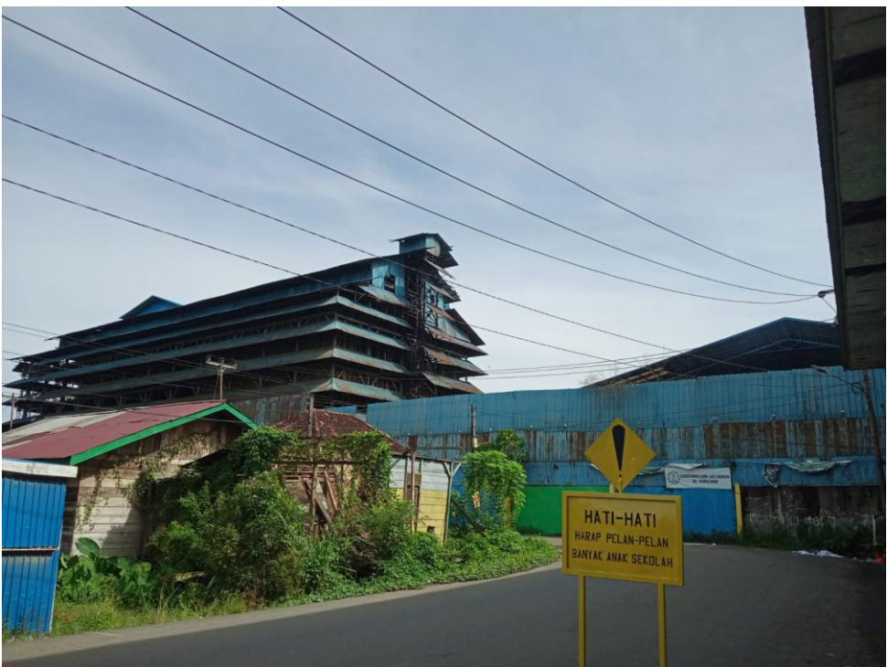
Lokasi Sekolah Yang Bersebalahan dengan Pabrik getah