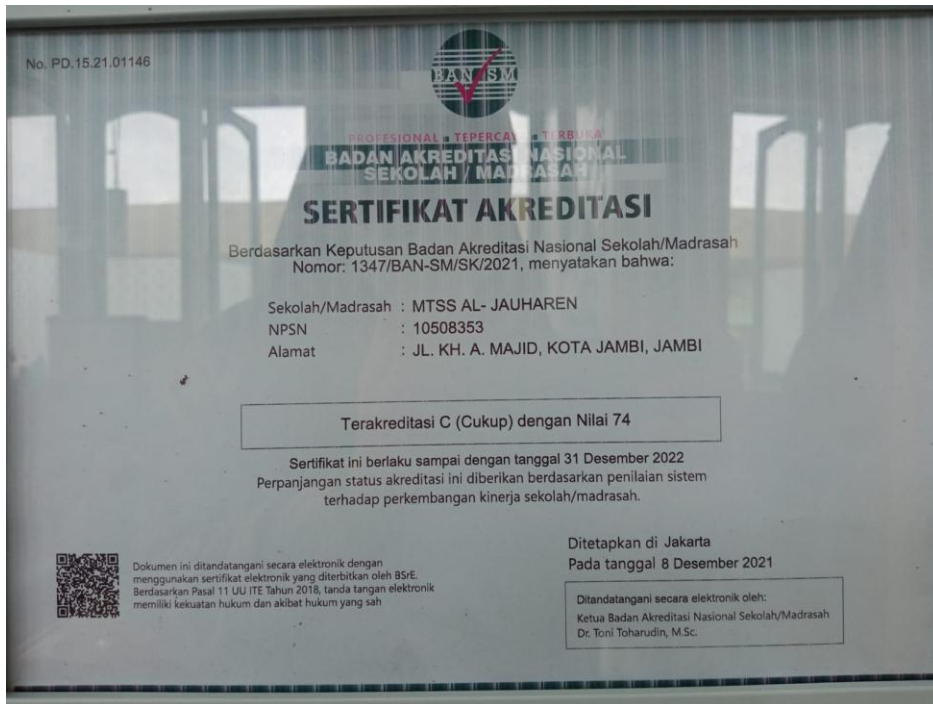
Sertifikat Akreditasi MTs Al – Jauharen Kota Jambi