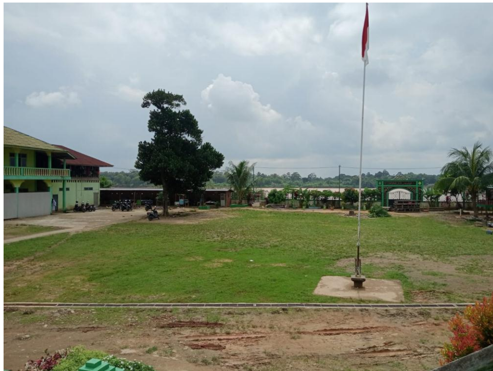
Lapangan Ponpes Al - Jauharen

State Islamic University of Sulthan Thaha Saifuddin Jambi