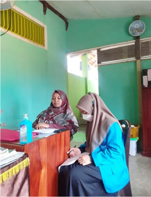
Wawancara Waka Sarpras