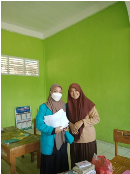
Wawancara bersama siswa MTs Al – Jauharen