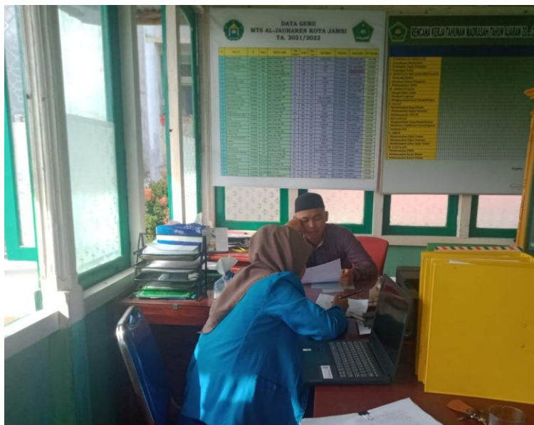
wawancara Kepala Sekolah