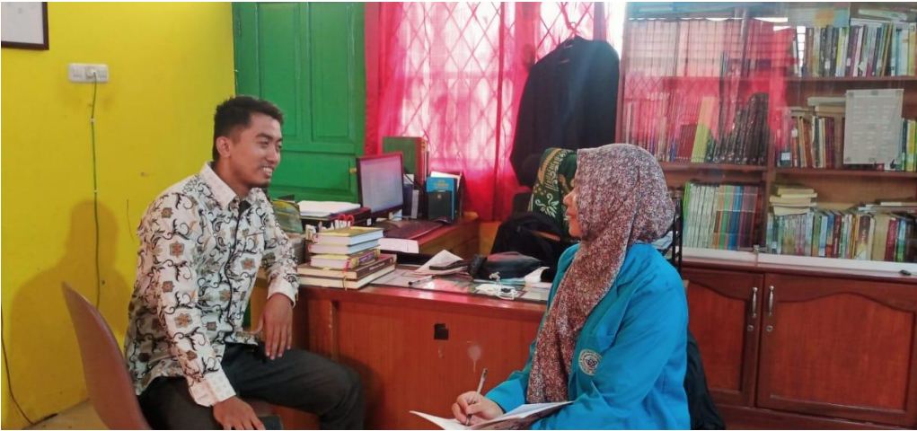
مقابلة مع رئيس هيئة إشراف اللغة