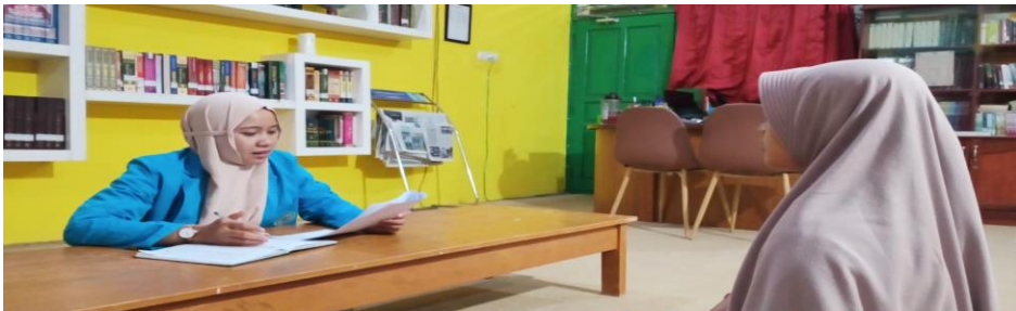
مقابلة مع قسم اللغة