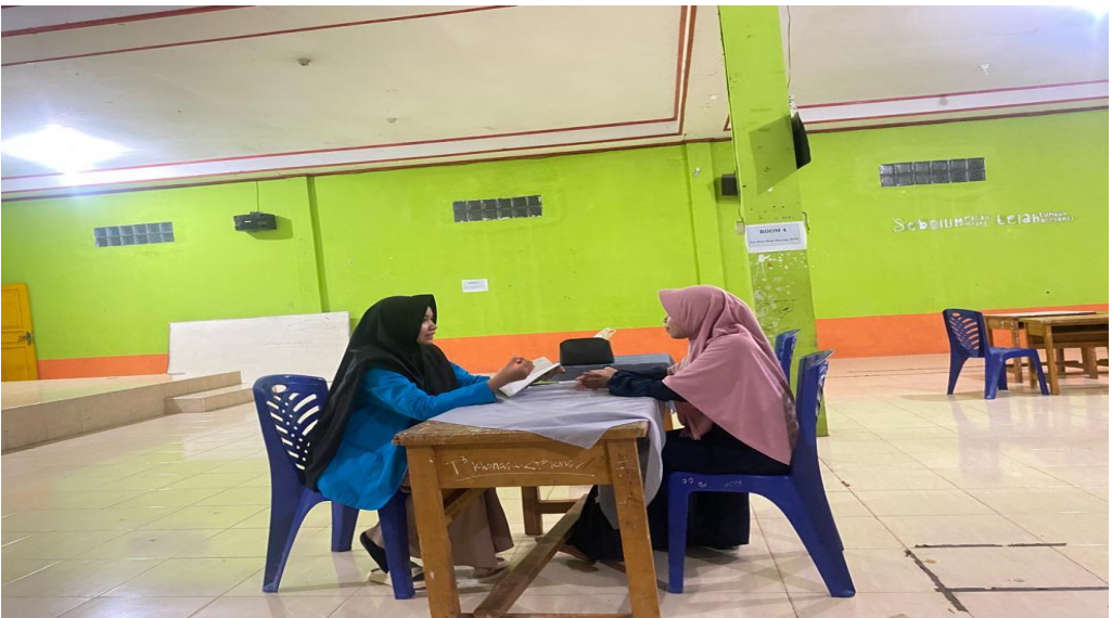
مقابلة مع مشرفة