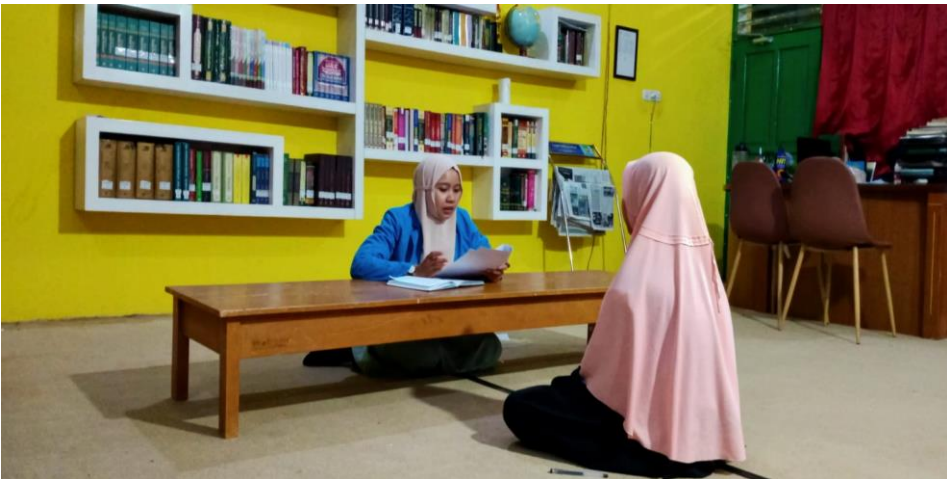
مقابلة مع سكرتيرة قسم اللغة