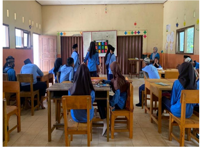
مقابلة مع التلاميذ فصل ٨ مدرسة الثانوية نور الهدى