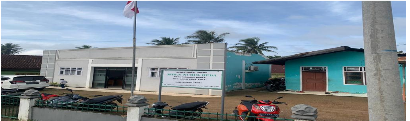
مراقبة في مدرسة الثانوية نور الهدى