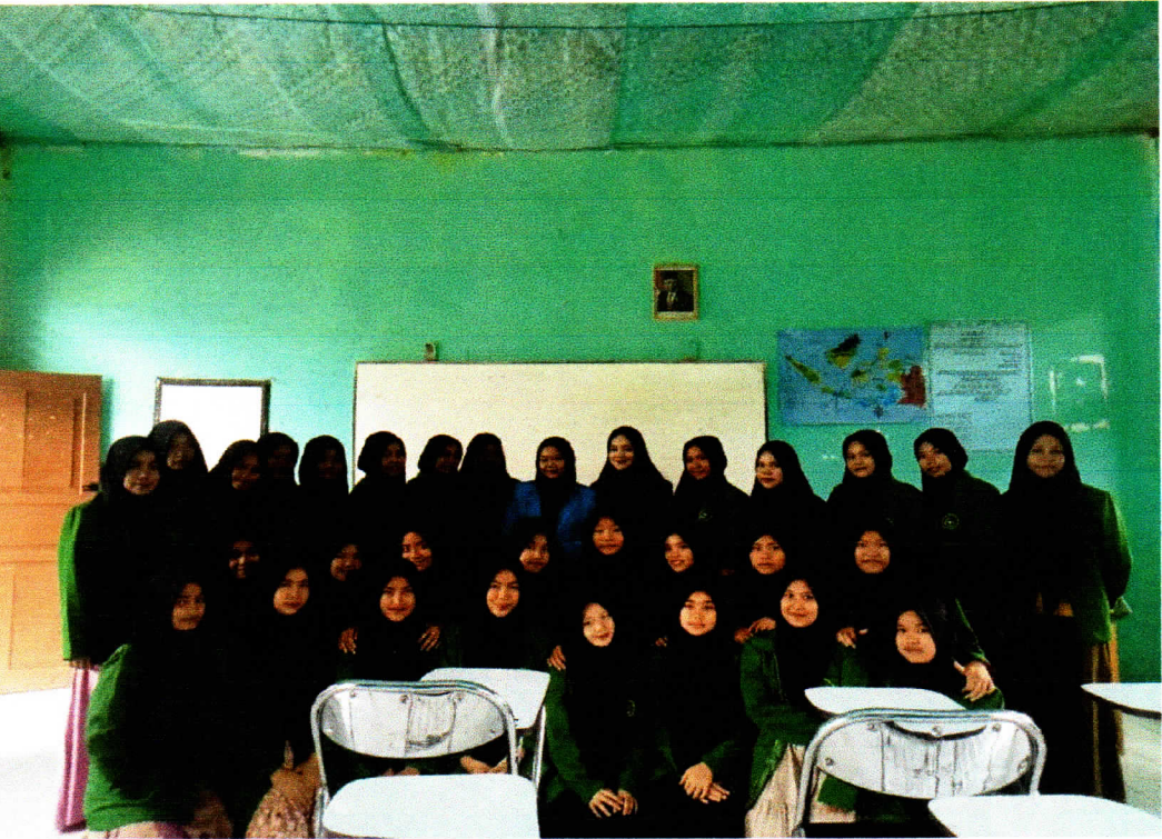
صورة-٣: صورة مع التلاميذ في معهد المجاهدة بانكو