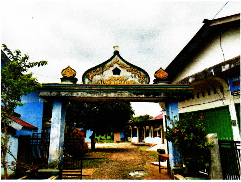
صورة-١ : معهد "المجاهدة" بانجكو المنطقة مراعين