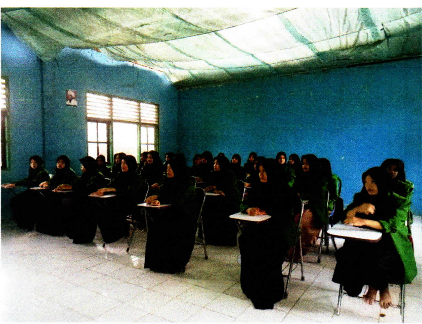
صورة-٢ : تعلم الأغاني العربية في الفصل