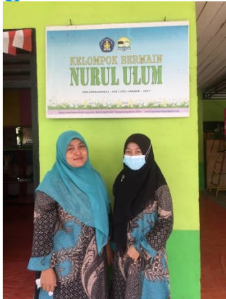
Bersama Kepala sekolah