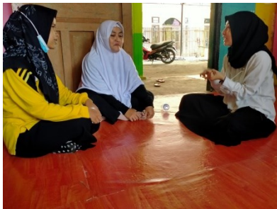
Wawancara dengan kepala sekolah