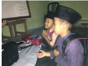
Salah satu anak murid yang sulit dalam ber komunikasi