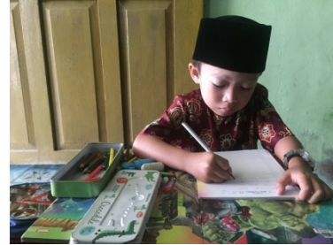
Salah satu anak murid KB B