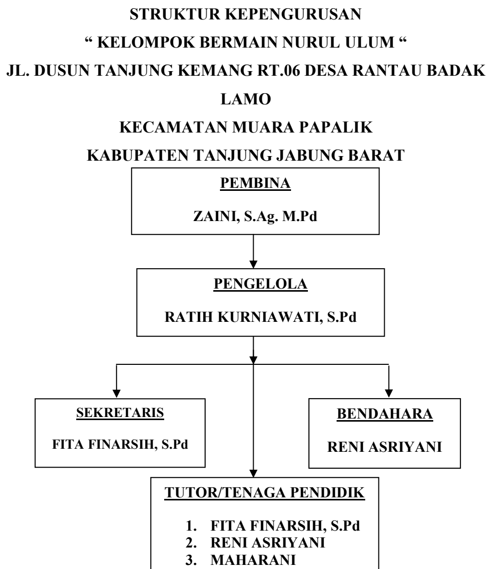
Bagan Struktur Organisasi KB Nurul Ulum Rantau Badak Lamo dari Tahun 2017-