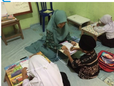
Interaksi saya bersama anak murid