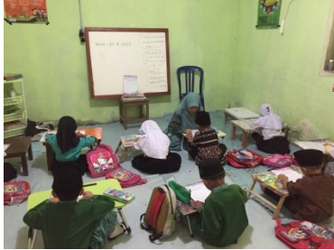
Foto di dalam kelas KB B