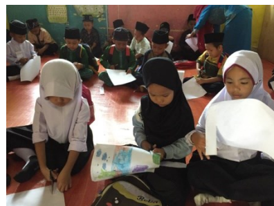
anak murid yang menjalani tugas oleh guru