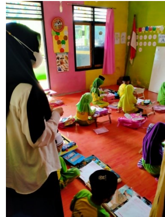
observasi dalam kelas KB B