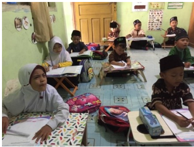
Anak murid di dalam kelas KB B