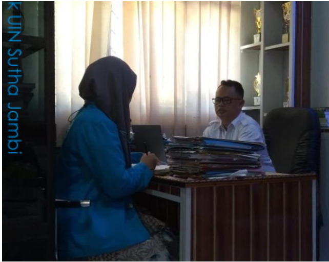
Wawancara dengan Kepala Madrasah