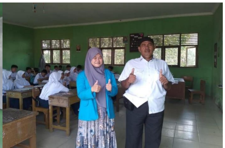
Wawancara dengan Penanggung Jawab Agama