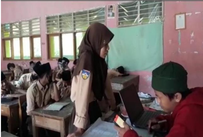
Setoran hapalan juz 30 dan siswa sedang sholat dhuha