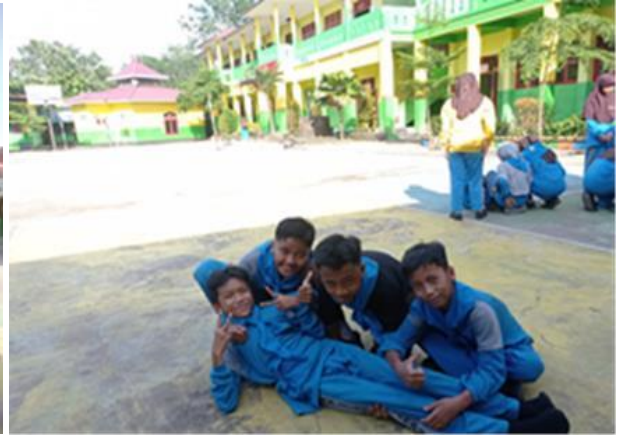
Kegiatan Latihan Ekstrakurikuler PMR