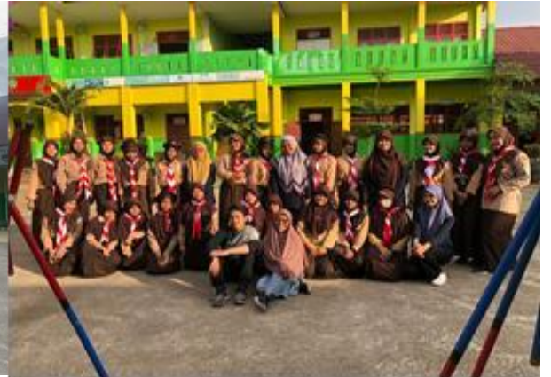
Kegiatan Latihan Ekstrakurikuler Pramuka