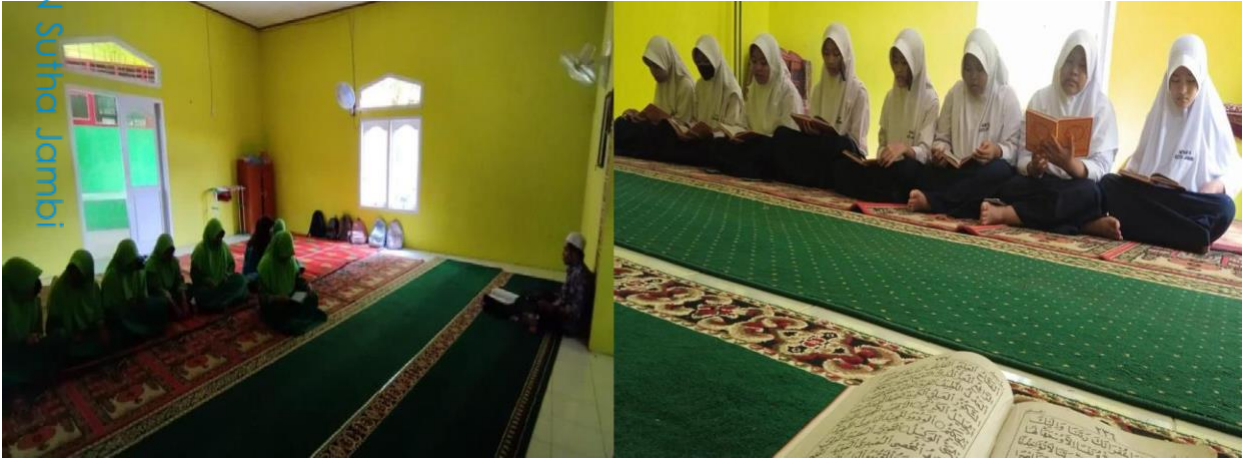
Kegiatan Latihan Ekstrakurikuler Tilawah dan Barzanji