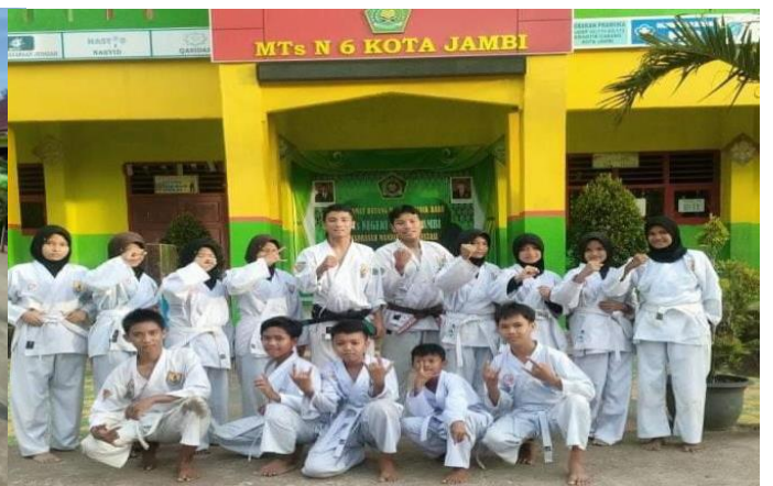
Kegiatan Latihan Ekstrakurikuler Silat