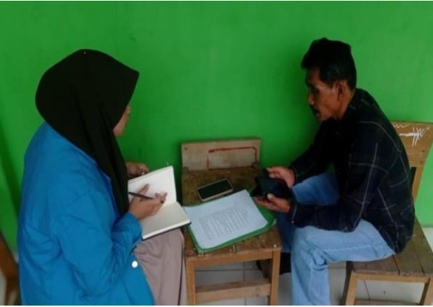
Wawancara dengan Pembina Silat