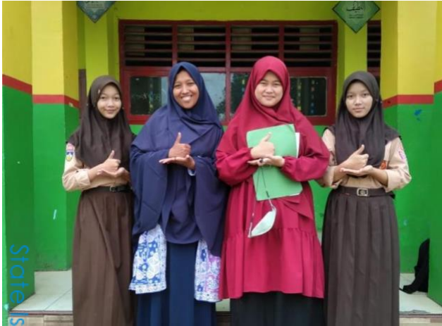
Wawancara dengan Pembina Pramuka