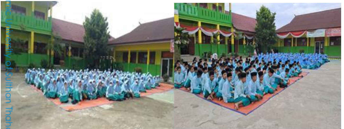
Kegiatan yasinan rutin setiap hari jum'at