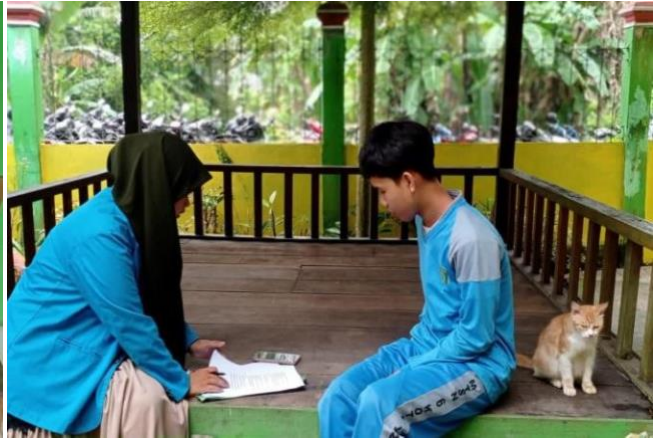
Wawancara dengan Siswa Silat