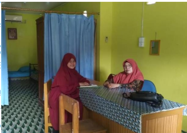
Wawancara dengan Pembina PMR