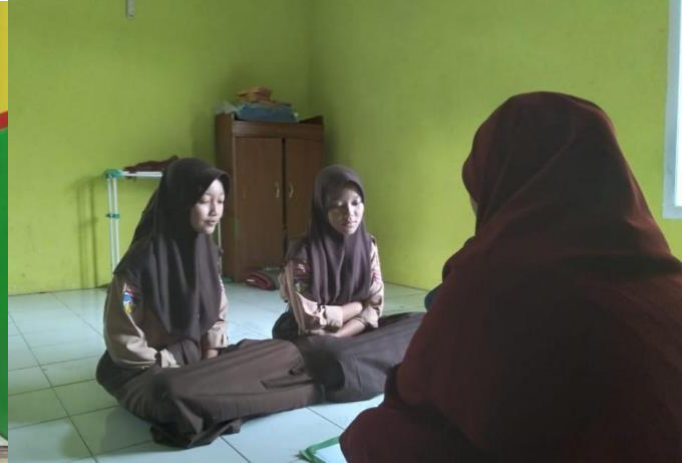
Wawancara dengan Siswa Pramuka