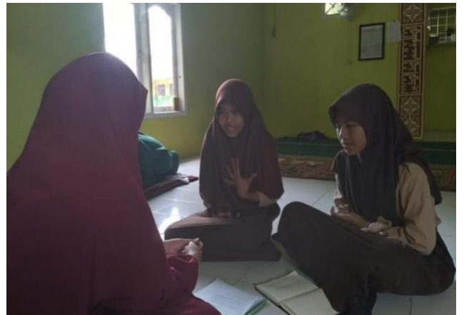
Wawancara dengan siswa PMR