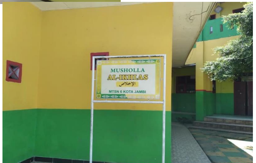
Keadaan Musholla Madrasah