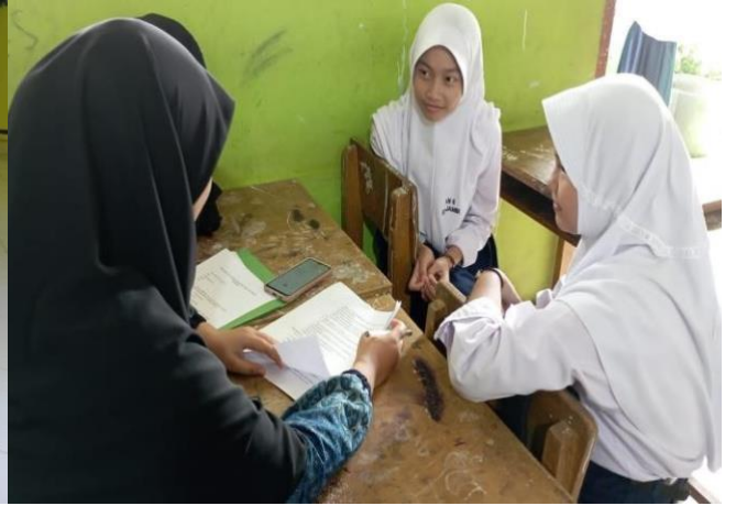
Wawancara dengan siswa ekstrakurikuler tilawah dan barzanji