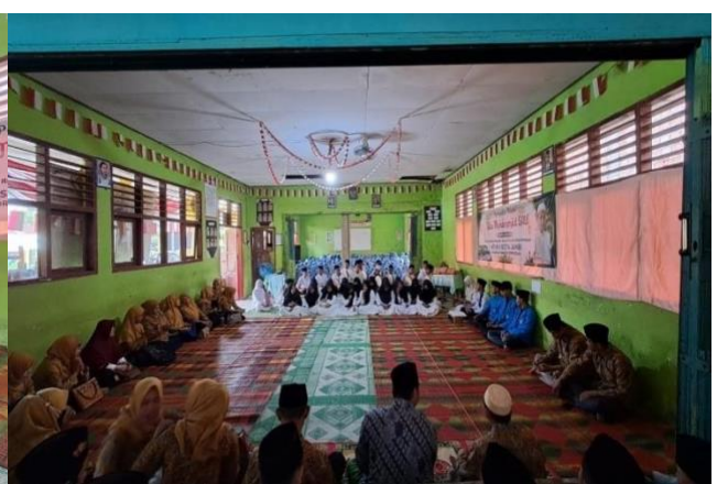
Peringatan Maulid Nabi Muhammad SAW 1444 H/2022 M