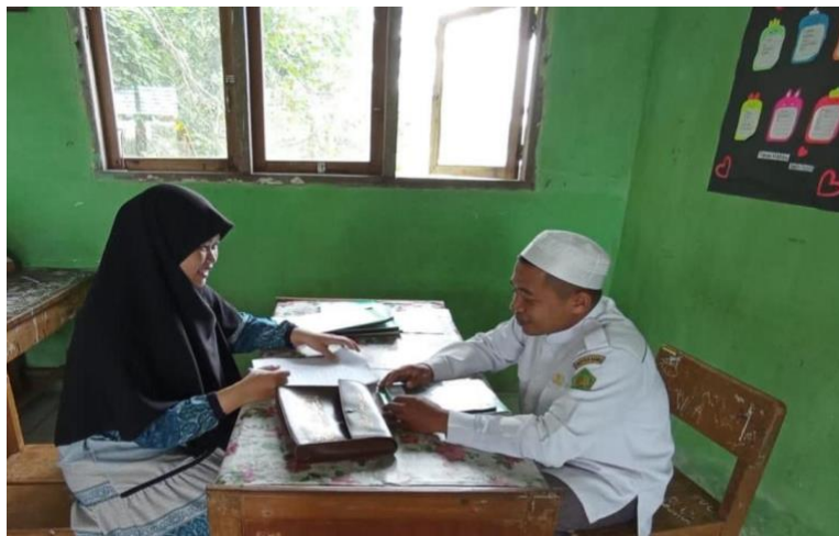
Wawancara dengan Pembina Ekstrakurikuler