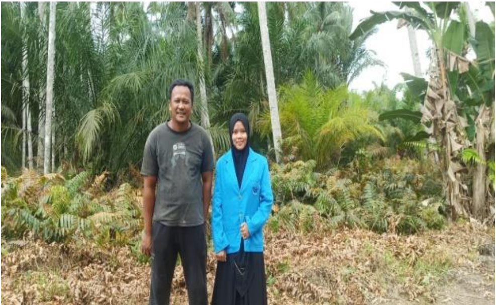
Dokumentasi Setelah Wawancara Dengan Bapak Saudi