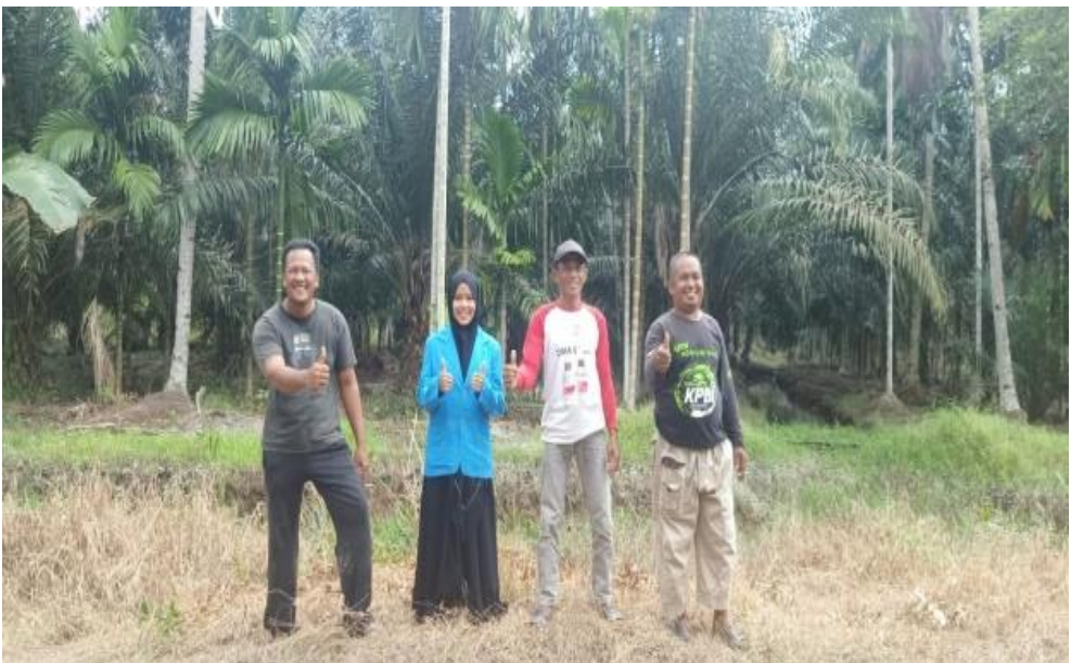
Dokumentasi Setelah Wawancara Dengan Pelaku Konversi Lahan