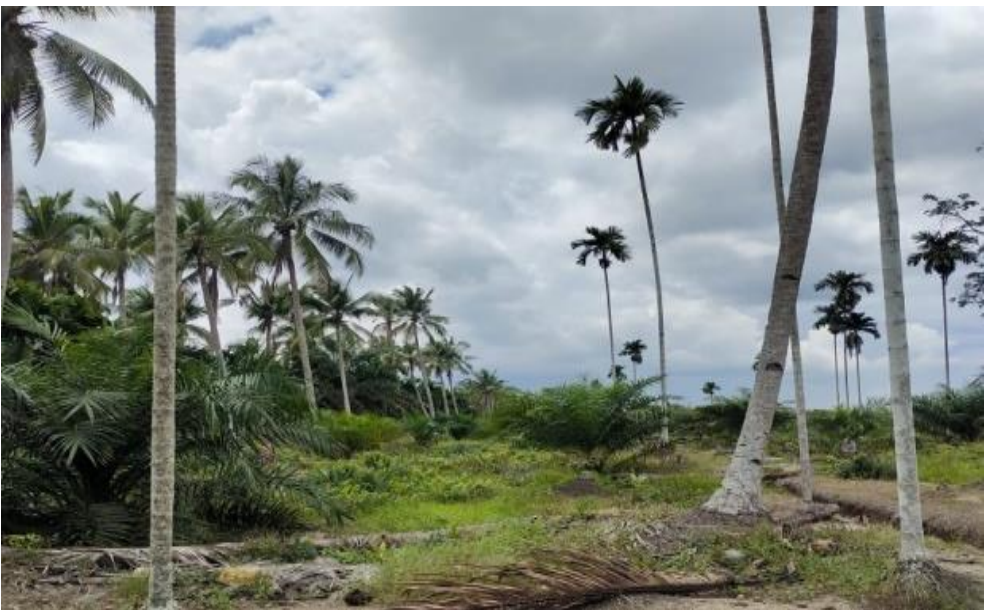
Kondisi Kebun Kelapa Lokal Yang Sudah Tidak Produktif Tumpang Sari Kelapa Sawit Yang Telah Berumur 2 Tahun