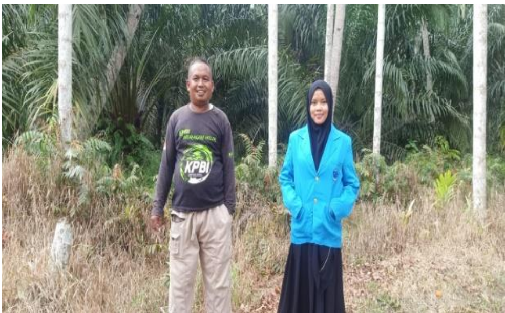
Dokumentasi setelah wawancara dengan Bapak Sultan