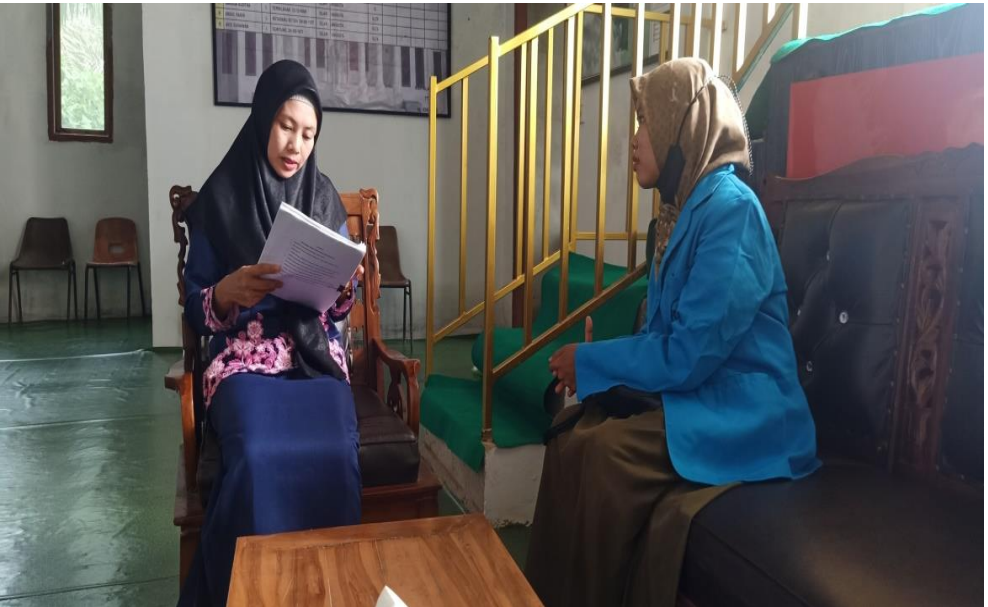
Dokumentasi Setelah Wawancara Dengan Staf Kantor Desa Kuala Keritang