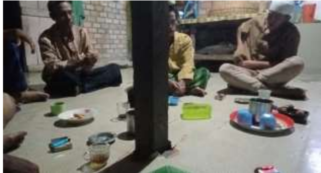
Duduk santai dan Bimbingan bersama anggota kelompok zikir