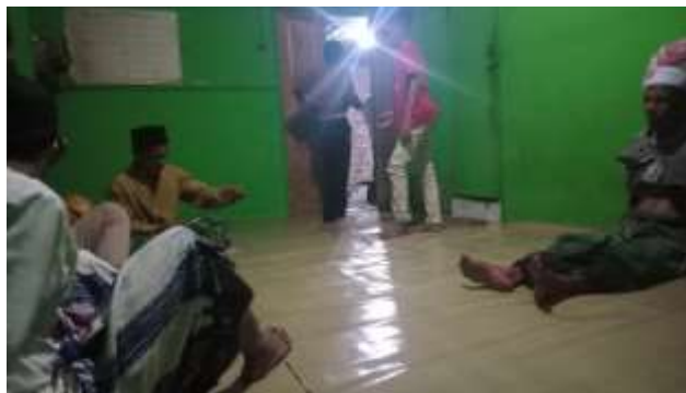
Akan dimulainya kegiatan zikir bersama kelompok zikir Desa Sarang Burung