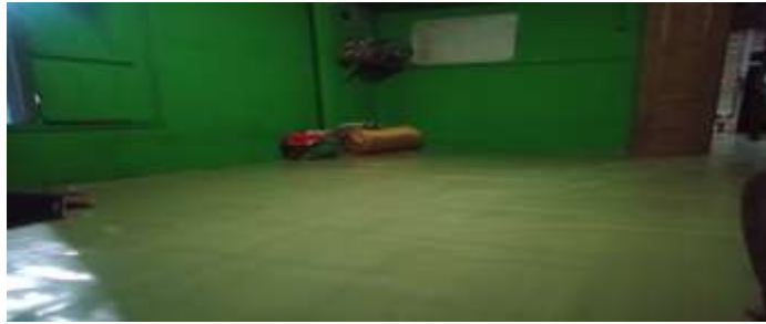
Ruangan yang menjadi tempat kegiatan kelompok zikir