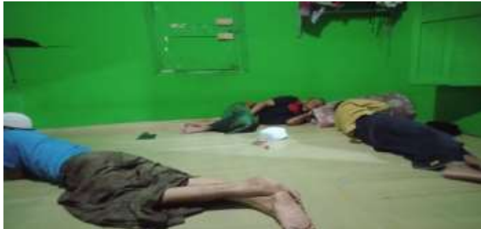
Anggota dan pasien setelah kegiatan kelompok zikir selesai