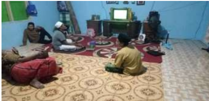
Nonton bersama sembari menunggu anggota kelompok zikir yang lain berkumpul